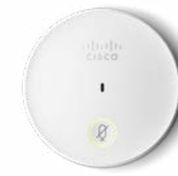
Cisco Table Microphone (卓上型)