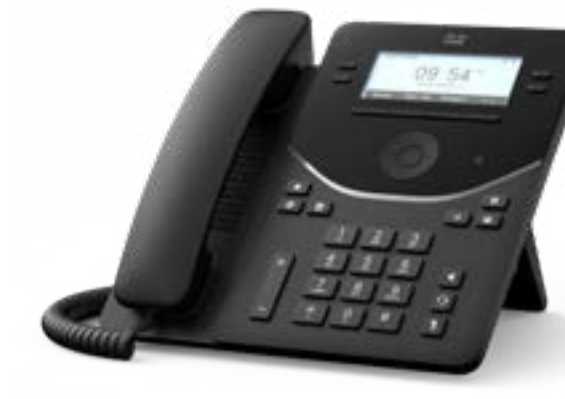
Cisco Desk Phone 9841

2.6 インチ グレースケール ディスプレイ、2 回線、アクションボタン、優れたセキュリティを備えた、オンプレミス通話またはクラウド通話向けの IP 電話