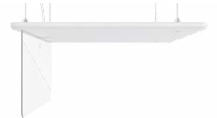
Cisco Ceiling Microphone (天井設置型)