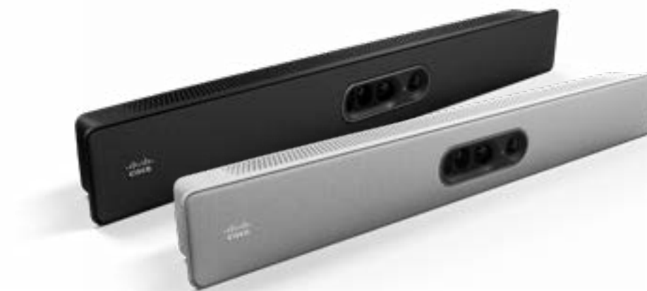
Cisco Quad Camera

高度な画像処理が可能で、設置場所を選びません。 スピーカーとプレゼンターの追跡機能、非常に広いスペース向けに 設計された高性能なパン、チルト、ズーム機能を備えています。