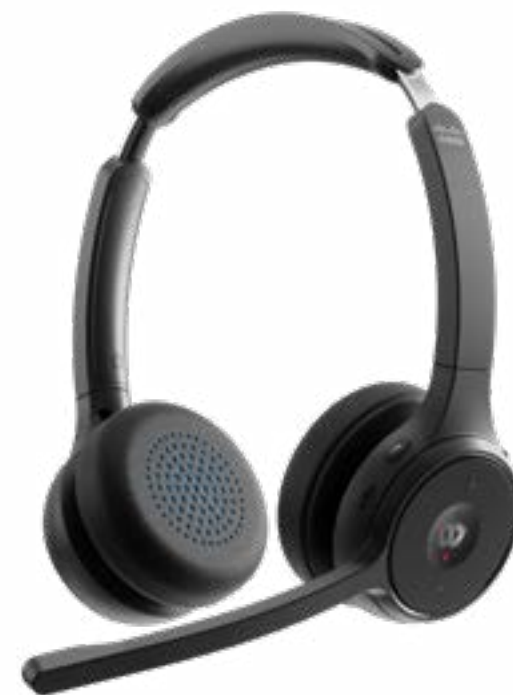
Cisco Headset 720 シリーズ