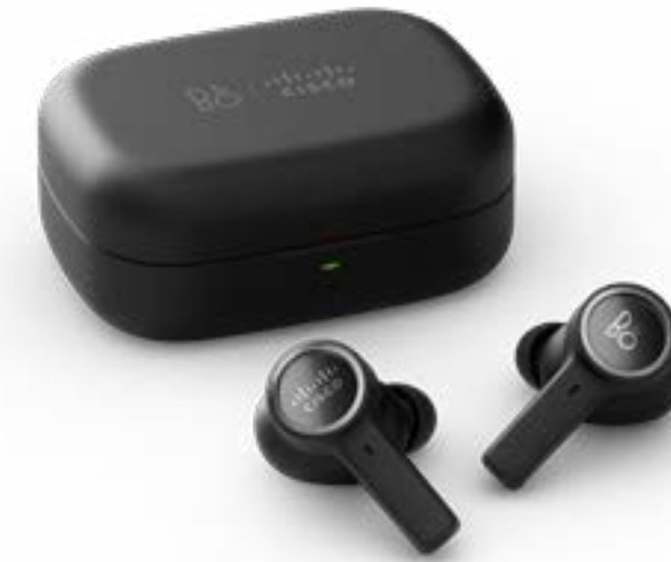
Bang & Olufsen Cisco 950