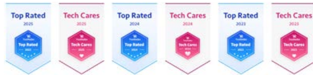
Cisco Room シリーズ