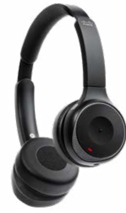
Cisco Headset 730