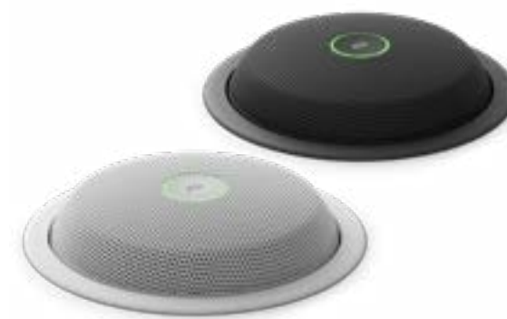
Cisco Table Microphone Pro

音声を鮮明に拾う指向性マイクを会議室に設置し、リモートの参加者にも、臨場感あふれる途切れることのないサウンド体験を提供