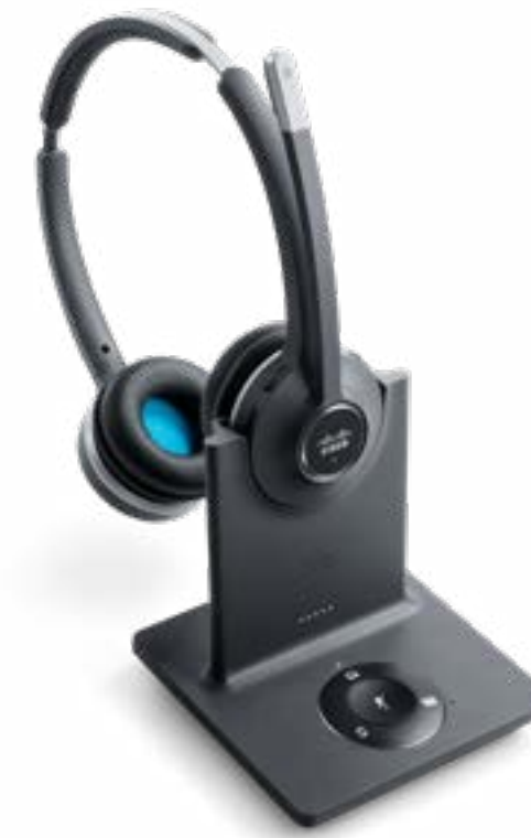
Cisco Headset 560 シリーズ