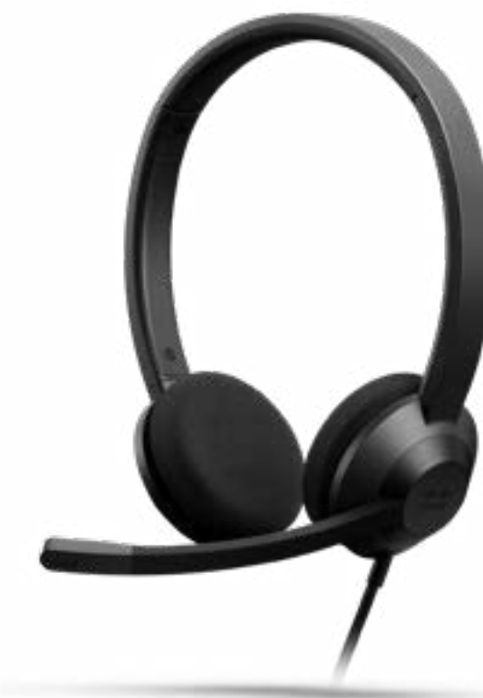
Cisco Headset 320 シリーズ