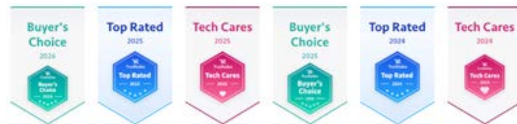
シスコのヘッドセット