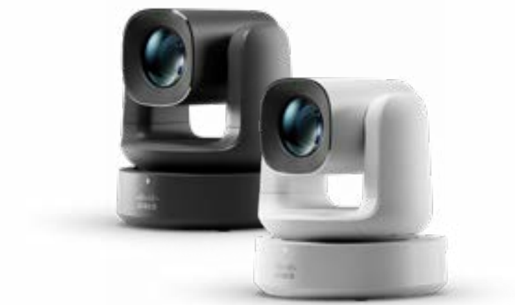
Cisco Room Vision PTZ