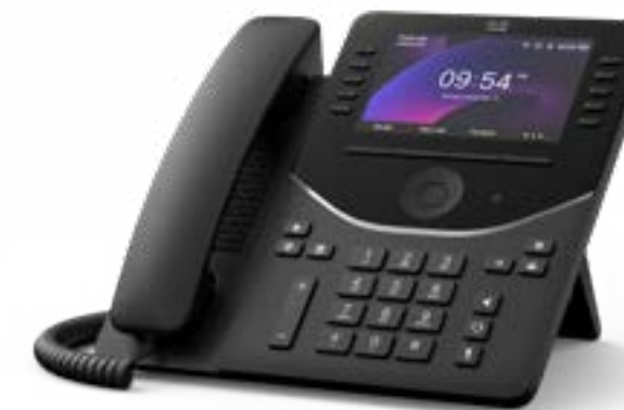
Cisco Desk Phone 9861

3.7 インチカラーディスプレイ、6 回線、ノイズ除去、ホットデスクング、アクションボタン、優れたセキュリティを備えた、オンプレミス通話またはクラウド通話向けの IP 電話