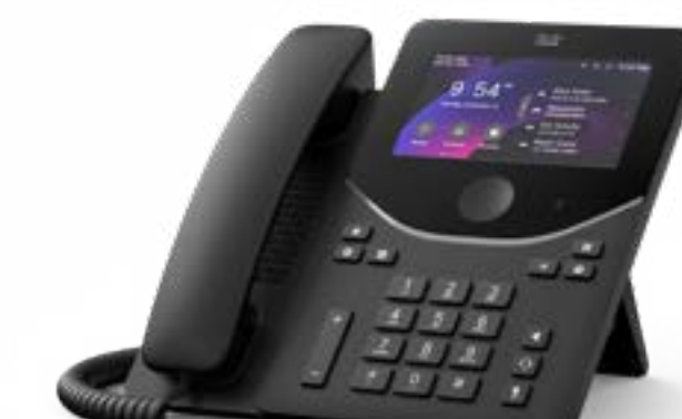
Cisco Desk Phone 9871

5 インチカラーディスプレイ、10 回線、AI を活用した音声、Wi-Fi、ホットデスクング、アクションボタン、優れたセキュリティを備えた、オンプレミス通話またはクラウド通話向けの IP 電話