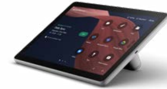
Cisco Room Navigator (卓上設置型)