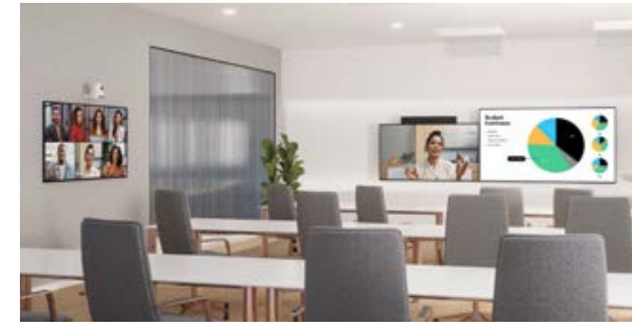
研修室 & コミュニティ