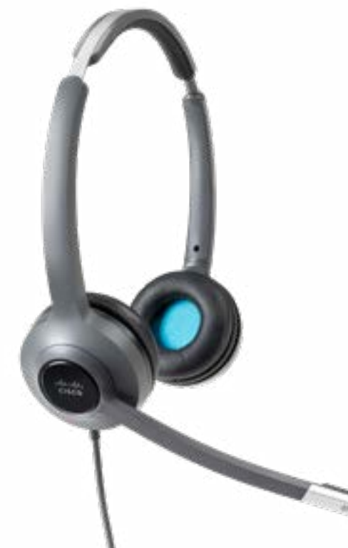
Cisco Headset 520 シリーズ