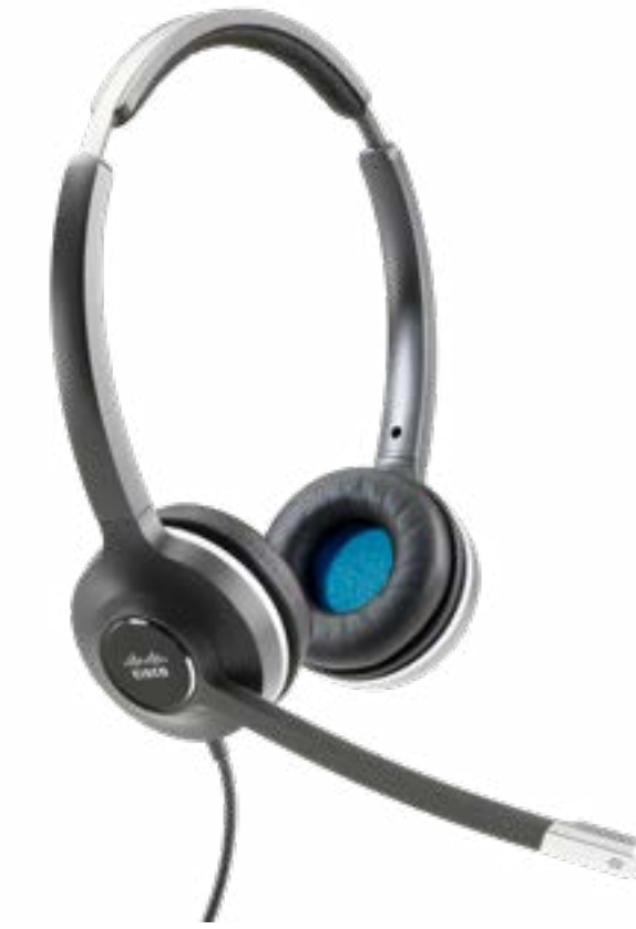
Cisco Headset 530 シリーズ