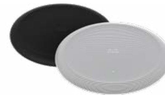
Cisco Ceiling Microphone Pro