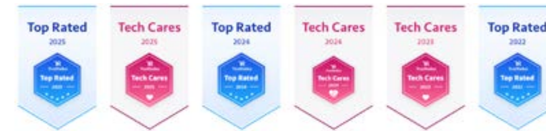
Cisco Phone シリーズ