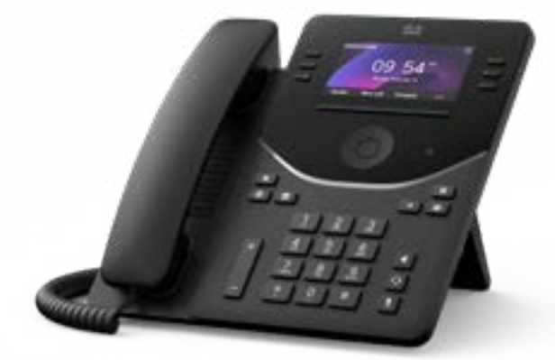
Cisco Desk Phone 9851

3.5 インチ グレースケール ディスプレイ、4 回線、ノイズ除去、ホットデスクング、アクションボタン、優れたセキュリティを備えた、オンプレミス通話またはクラウド通話向けの IP 電話