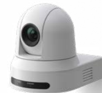
Cisco PTZ 4K カメラ