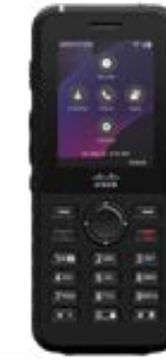
Cisco Wireless Phone 9821

2.4 インチカラーディスプレイ、6 回線、ノイズ除去、耐衝撃性、アクションボタン、交換可能なバッテリー、シングルおよびマルチチャージャー ステーション、優れたセキュリティを備えた、オンプレミス通話またはクラウド通話向けのワイヤレスフォン