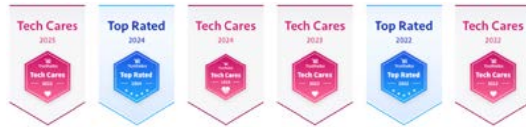
Cisco Desk シリーズ

シスコは企業向けビデオ会議システムにおける IDC MarketScape リーダーに選出されました。