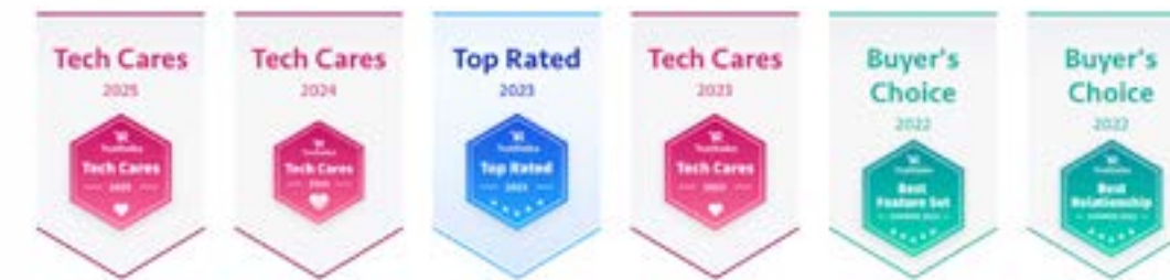
Cisco Board シリーズ